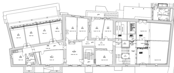
Plan 1 er étage - Mairie